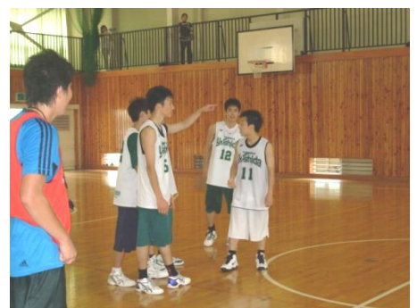
仲間同士で指示を出し合う現役メンバ