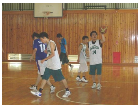
現役：あきらめずに頑張るぞ！