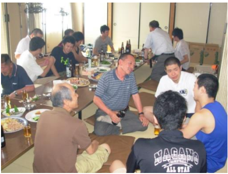
上写真：今年も世代をこえて盛り上がりました！